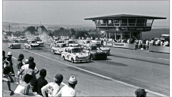
Trabant 085 – 1985 Sachsenring

Vortrag Jens Conrad „Trabant-Rennsport in der DDR“