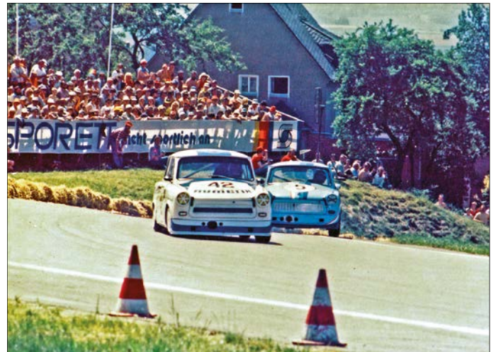
Trabant – Archiv Nickoleit_Sachsenring_23